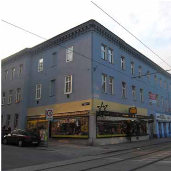
Vor bzw. während der umfassenden Sanierung