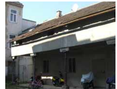
Vor bzw. während der umfassenden Sanierung